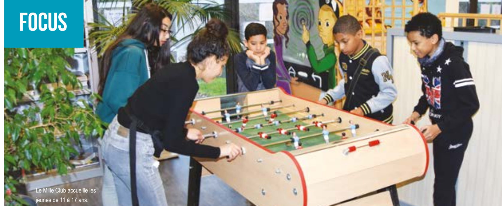
Le Mille Club accueille les jeunes de 11 à 17 ans.