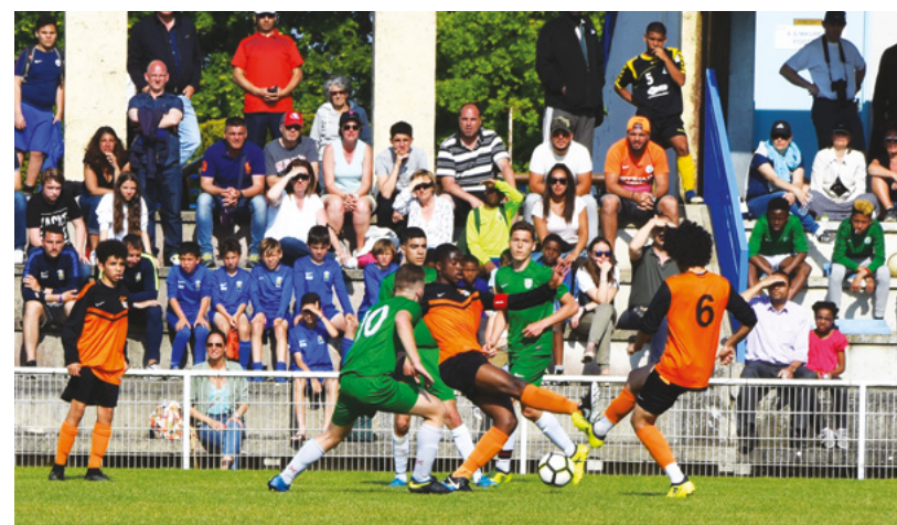
La finale des U17