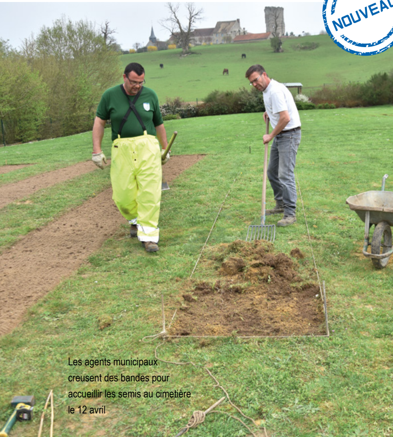
Les agents municipaux creusent des bandes pour accueillir les semis au cimetière le 12 avril.