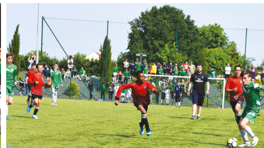
La finale des U13