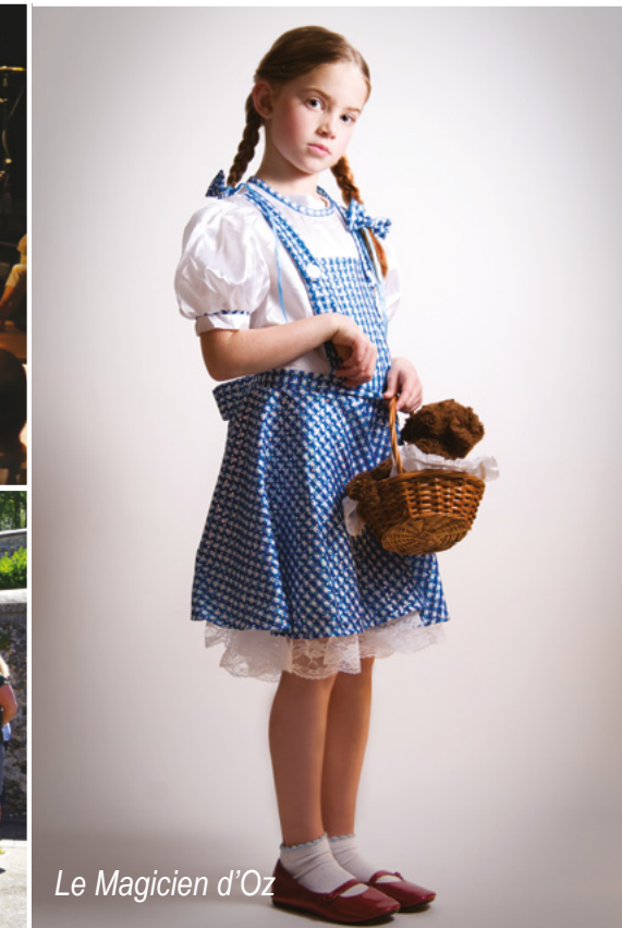
Le Magicien d'Oz