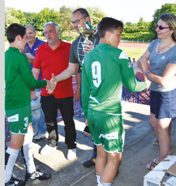
La remise des prix

Catégorie U17 : Boulogne-Billancourt (92), Maurepas, Les Ulis (91)