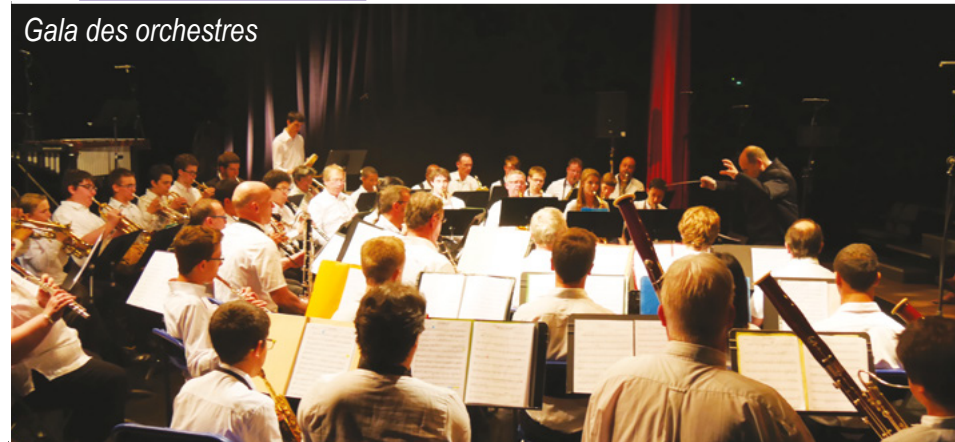
Gala des orchestres

La prise en charge est faite par des bénévoles ayant suivi une formation adaptée permettant d'apporter un moment de pause aux aidants. Pour plus d'informations, contactez l'Unité Locale de la Croix-Rouge française au 06 15 87 79 75. Tarif : 5€ par semaine