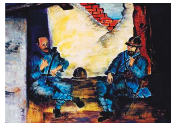
Éditions Connaissances et Savoirs Version papier : 22,50 € - Version numérique : 6,99 € www.connaissances-savoirs.com