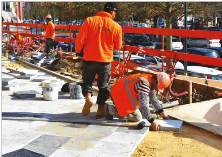
Devant les commerces (bar-tabac, agence immobilière, traiteur, boulangerie), les massifs fleuris ont été enlevés, le temps de poser le nouveau dallage avec la pierre bleue du Hainaut ( finition flammée) et le granit blanc ( finition bouchardée).