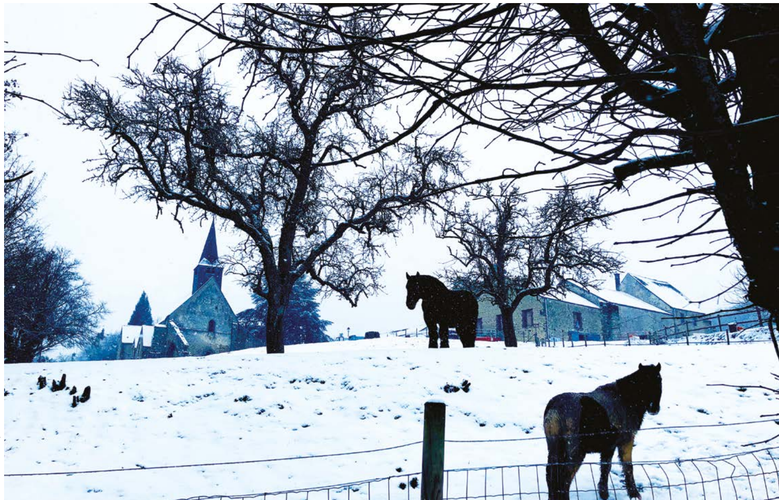
PHOTO DE MAUREPAS SOUS LA NEIGE