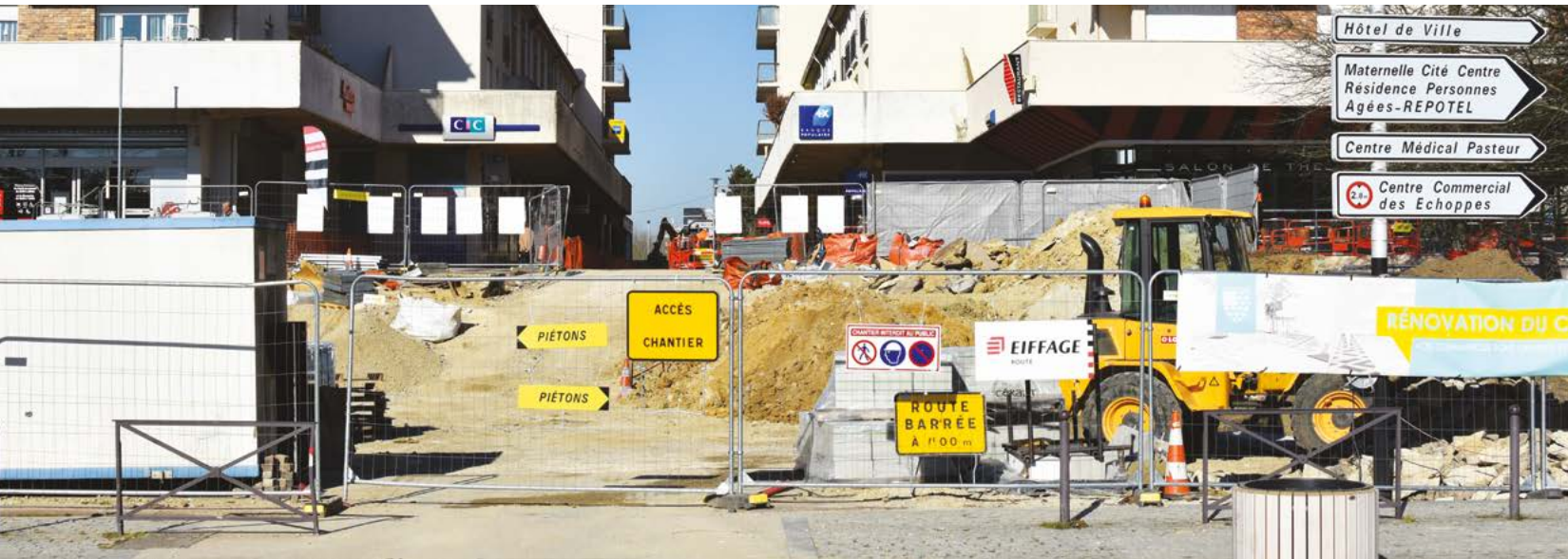
La première partie de la phase 3 vient de commencer et durera jusqu'au 22 mars. La perspective depuis la rue des Baux est désormais totalement dégagée. Les commerces demeurent ouverts et les places de stationnement sont toujours accessibles.

La réhabilitation du centre-ville est entrée dans une nouvelle phase. L'allée de la Côte d'or et ses abords se métamorphosent à un rythme soutenu.