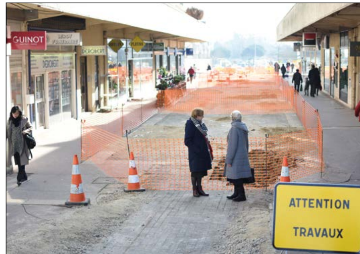
L'allée de la Côte d'Or a été débarrassée de son ancien mobilier urbain et des massifs. La place est libre pour le nouveau dallage.