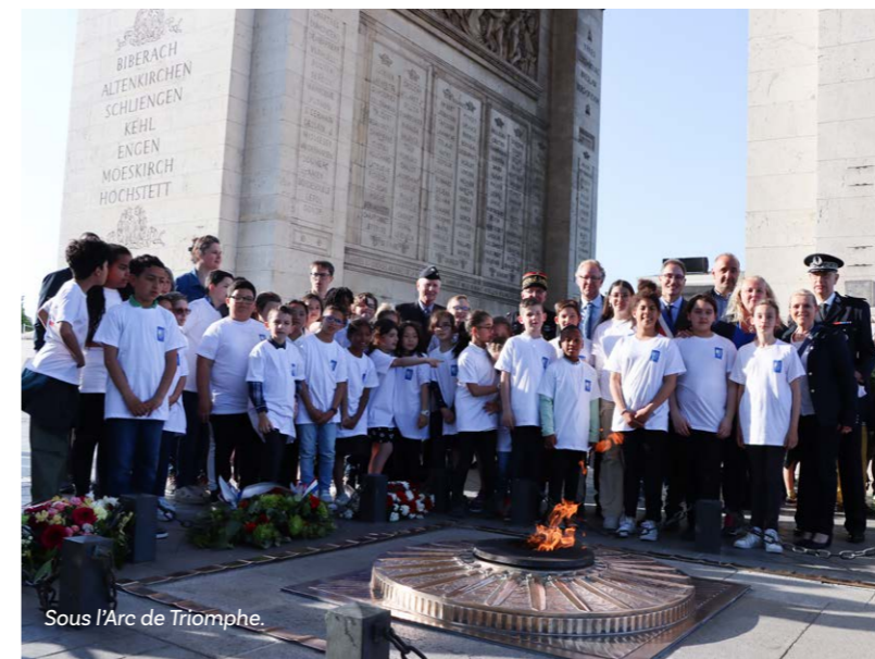
Sous l'Arc de Triomphe.

Le contexte actuel de tension sur le marché mondial des matières premières a généré une inflation des coûts. La Ville a été obligée de procéder à des ajustements de son projet (réadaptation technique) pour réussir à limiter ces surcoûts dans le budget communal.