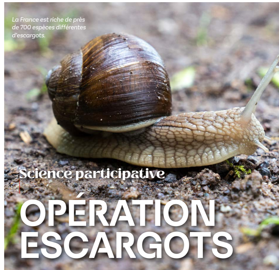
La France est riche de près de 700 espèces différentes d'escargots.