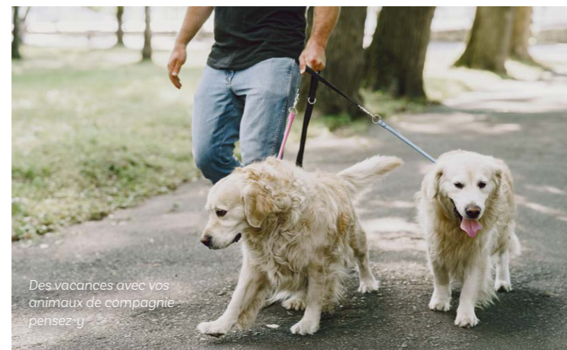
Des vacances avec vos animaux de compagnie, pensez-y

Si vous partez cet été avec vos animaux de compagnie, il faut anticiper leur séjour, comme pour les autres membres de la famille.