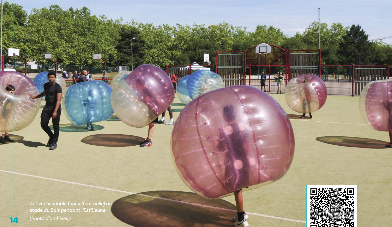
Activité « bubble foot » (foot bulle) au stade du Bois pendant l'Esti'Jeune.