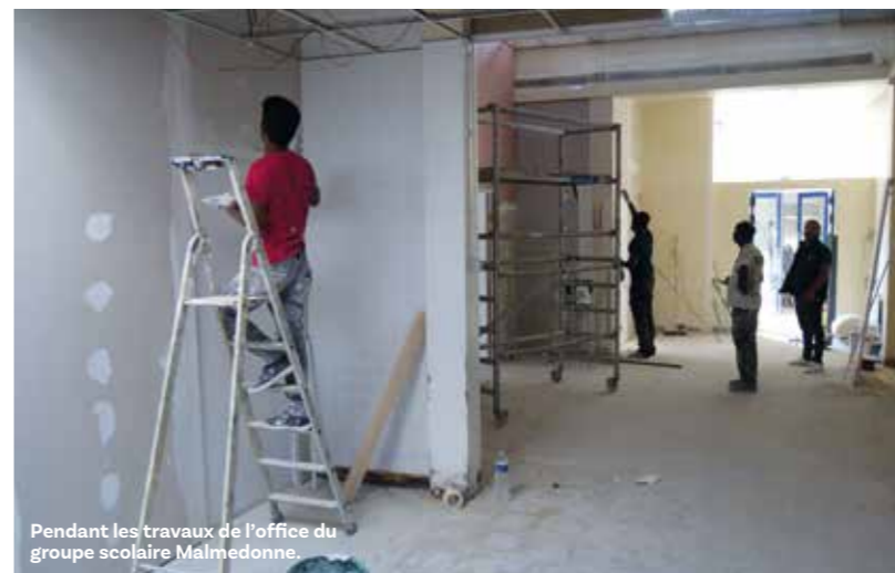
Pendant les travaux de l'office du groupe scolaire Malmédonne.

Jeudi 1 er septembre, les réveille-matin sonneront le glas des vacances dans les foyers maurepasiens.