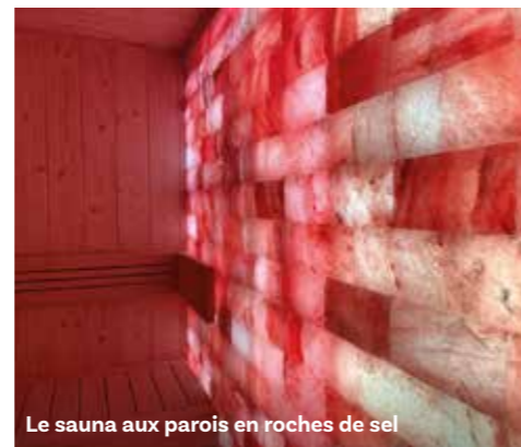
Le sauna aux parois en roches de sel

Adjoint au maire délégué au Sport, à l'Action sociale, à la Santé, au Handicap et au Logement.