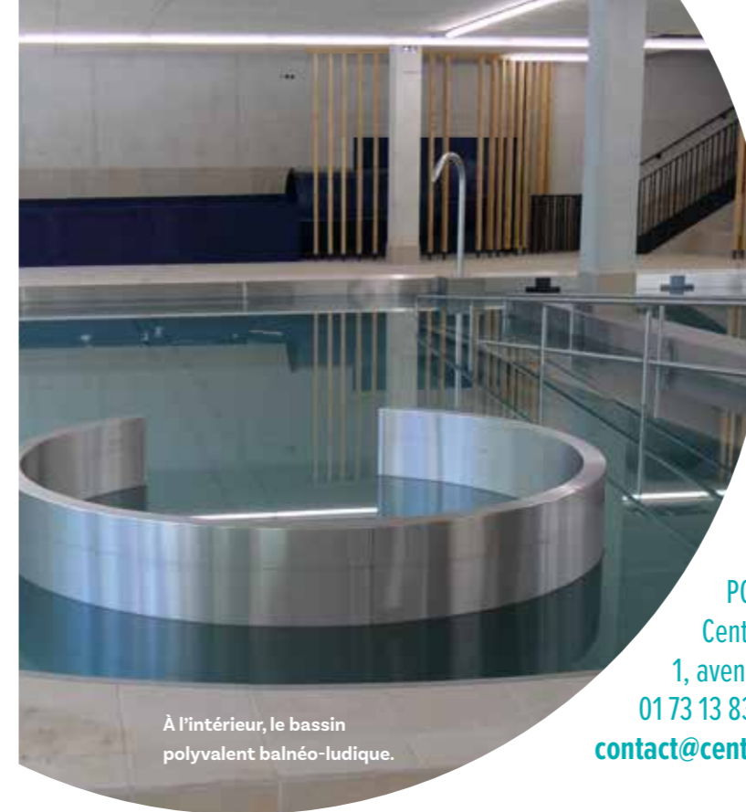
À l'intérieur, le bassin polyvalent balnéo-ludique.

Les zones vitrées en façade et en toiture sont équipées d'un vitrage bioclimatique à contrôle solaire.