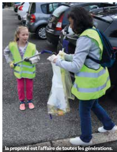
la propreté est l'affaire de toutes les générations.

Plusieurs partenaires de la Ville fourniront informations et conseils