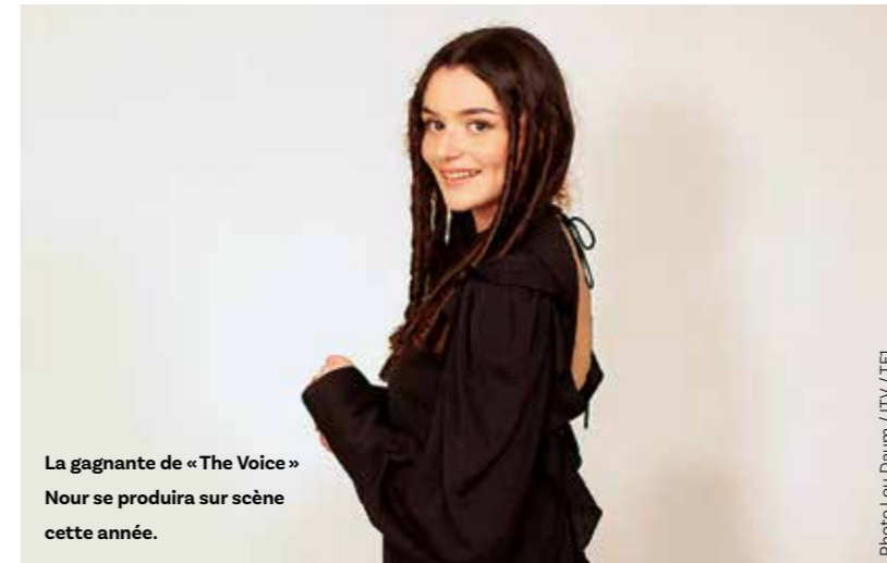
La gagnante de « The Voice » Nour se produira sur scène cette année.

C'est une nouveauté : notre belle cité sera en fête en septembre et non en juin, comme il était de tradition. Les réjouissances auront lieu au parc des sports du Bout des Clos. Nour sera de la fête !